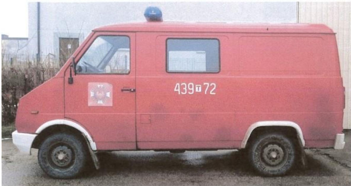
fot. 5 – lewa strona pojazdu