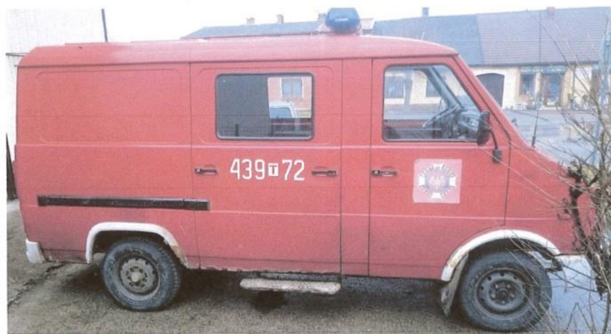
fot. 4 – prawa strona pojazdu