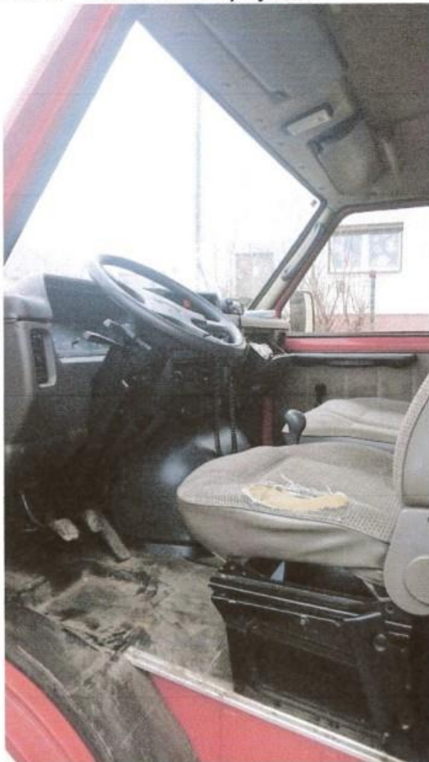
fot. 6 – przedział kierowcy