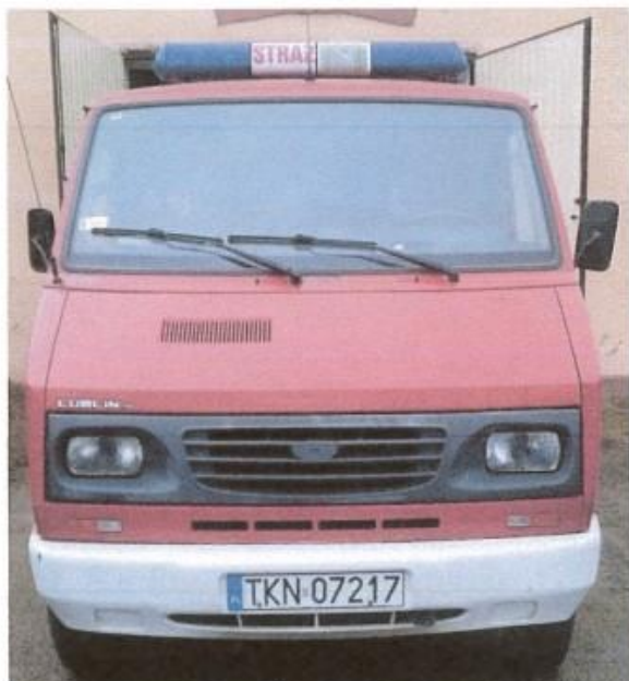
fot. 1 – przód pojazdu