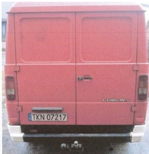
fot. 2 – tył pojazdu