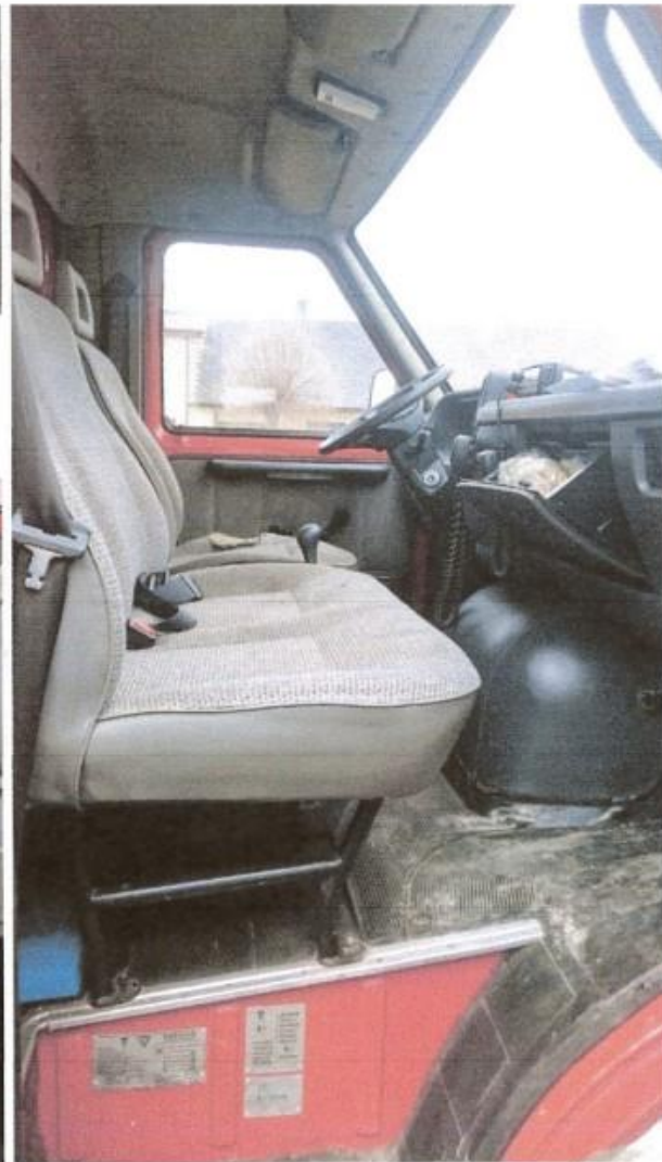
fot. 7 – przedział pasażera