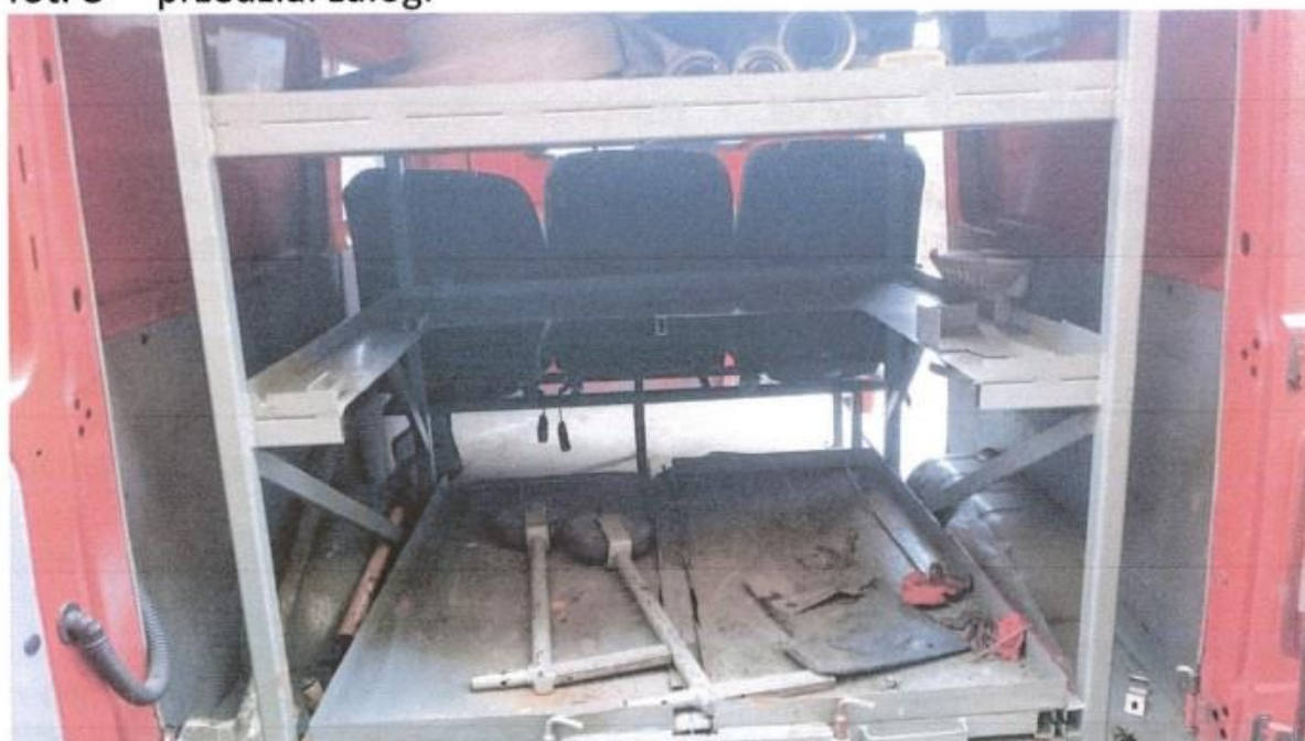
fot. 9 – przedział tylny – pompy i węży