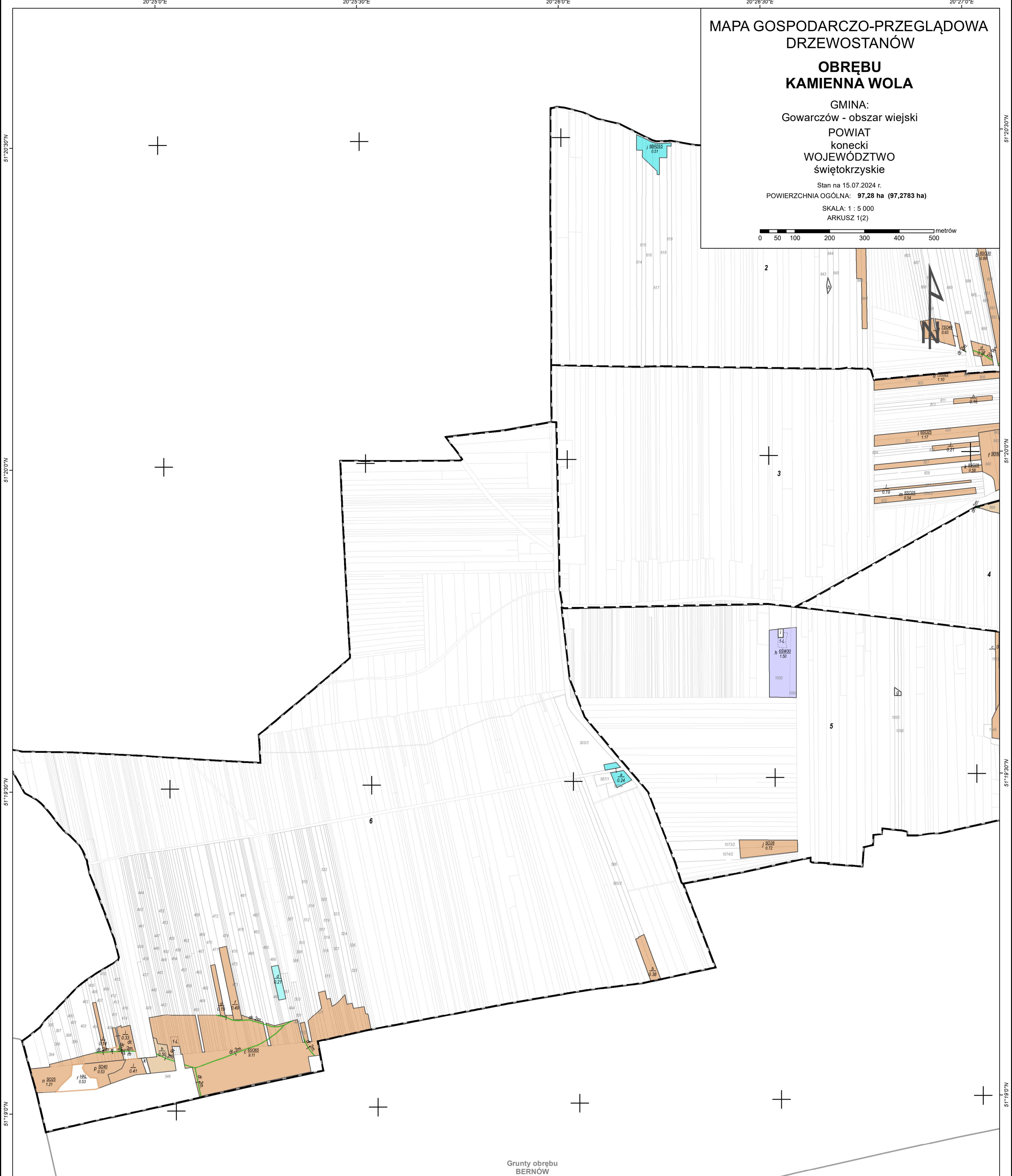
Grunty obrębu BERNÓW